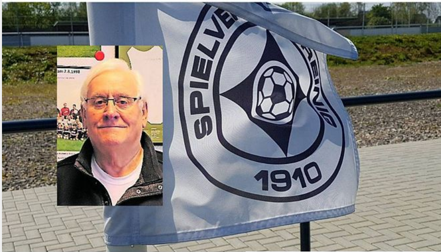
Dienstag 11.02.20 12:00 Uhr | Autor: AZ/AN | 527